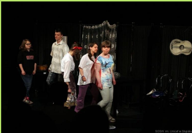
SOSW im. Unicef w Słupsku